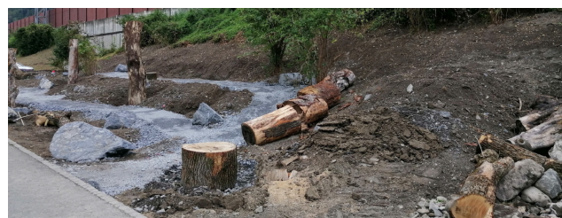
Erste Strukturelemente für die naturnahe Lernumgebung am RDZ Sargans sind bereits ersichtlich.

Das RDZ Sargans ist ein zentraler Ort für die Aus- und Weiterbildung von Lehrpersonen sowie für verschiedene Dienstleistungen für Schulen. Im Jahr 2022 besuchten 5'317 Kinder das RDZ, während knapp 683 Lehrpersonen und weitere 749 Teilnehmer Weiterbildungskurse besuchten. Darüber hinaus fanden 1'460 Studierende sowie 532 weitere Besucher den Weg ins RDZ.